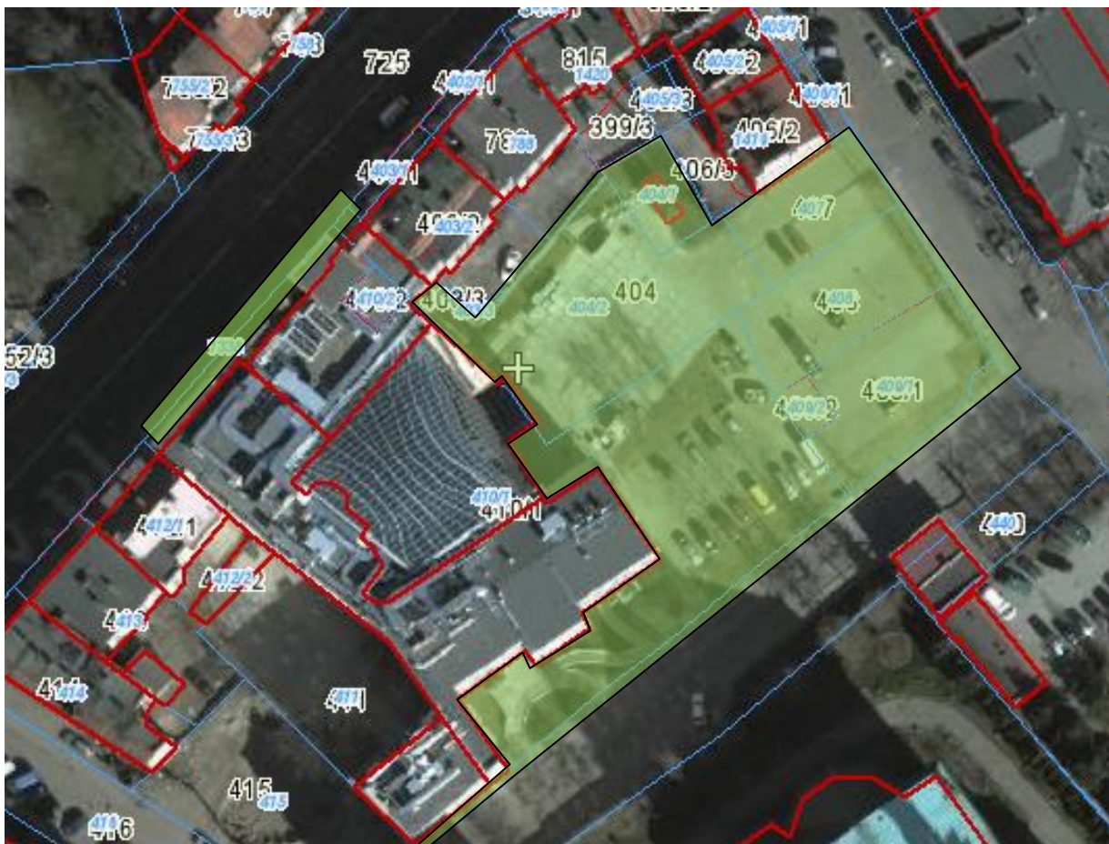
Załącznik graficzny terenu zewnętrznego obiektu – biurowiec LETIA (teren zewnętrzny zaznaczony na zielono przeznaczony do dozoru).