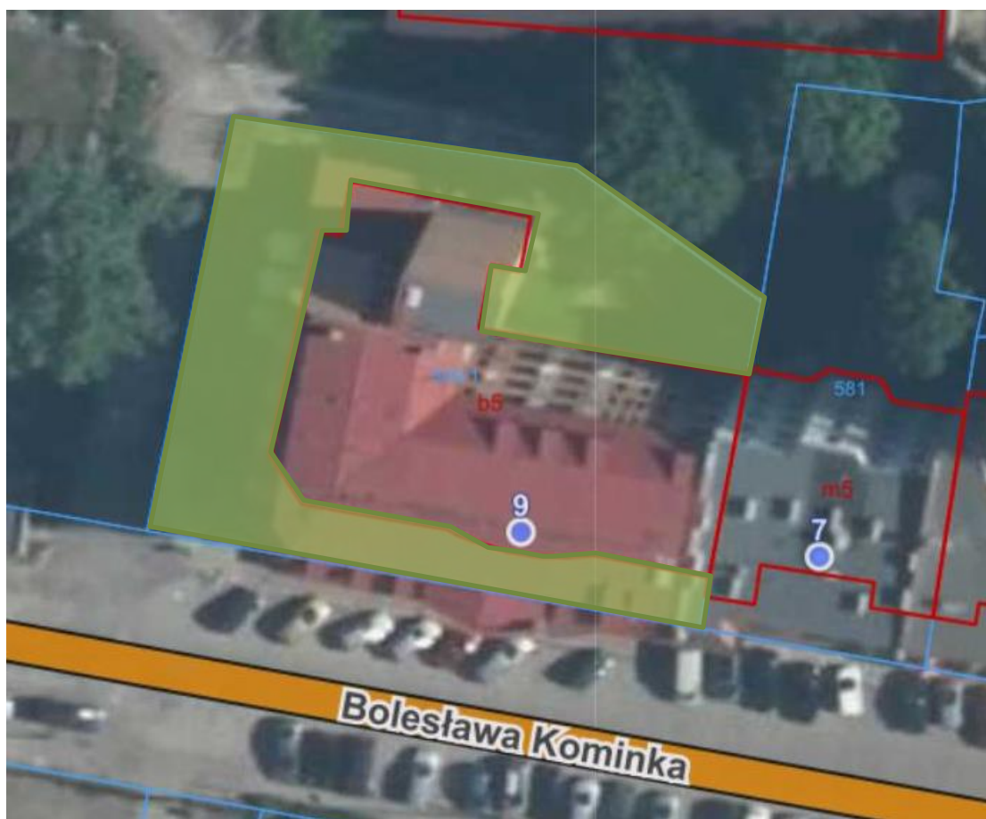
Załącznik graficzny terenu zewnętrznego obiektu biurowego przy ul Kominka 9 w Legnicy. (teren zaznaczony na zielono przeznaczony do dozoru).